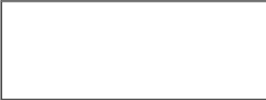
IMAGEN - 2